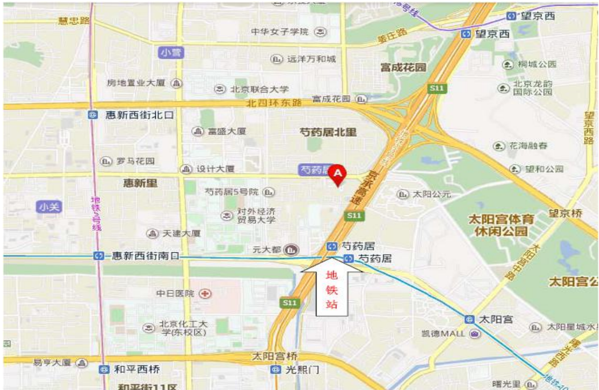
中煤协联合认证（北京）中心会议室位置示意图（红圈处）